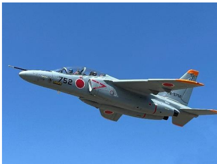
イムハタ氏による T-4 練習機