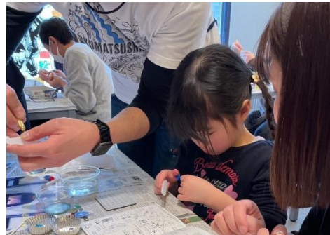
前回のワークショップの様子