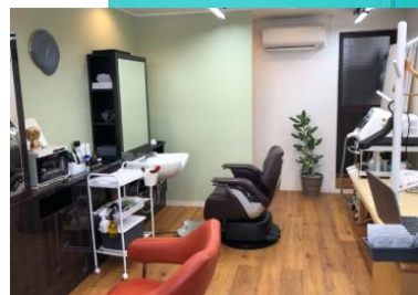
オーナーと店舗内観