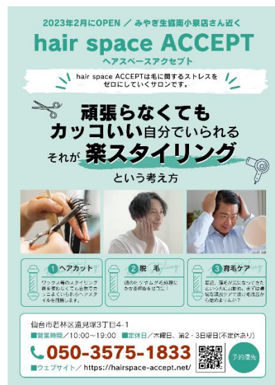
楽スタイリング・メニューを掲載したポスティングチラシ