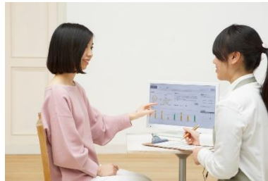
コイン型の活動量計(左)と 可視化したデータでのアドバイス(右)

②「ねむりの相談所」では東北初導入となる N3D-body により、あなたの身体の歪みを計測します N3D-body は全身 120 万か所を目に見えない光で計測し骨格の歪みを、3D アニメで参照できるシステムです。これで体の歪みがすぐに理解できます。