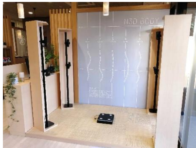
N3D-body のイメージ(左)と 当店に導入済みの実際の写真(右)

③お客様に合った眠りと睡眠環境改善の各種アドバイス、サポートツールのご紹介をします 睡眠改善の方法はさまざまです。睡眠時のアロマグッズやヒーリング音楽 CD を始め、オーダーメイドの枕・マットレスなどのご紹介をさせていただきます。ご自身に合ったツールを選択いただけます。