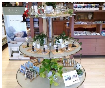
ハーブティ(左)と アロマやヒーリング音楽 CD(右)